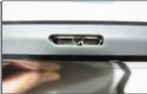
USB 3.0 Normal